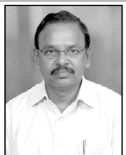
యన్.కుమార్ రాజు ఐక్య ఉపాధ్యాయ సంఘాధిపతి, సర్కూలర్