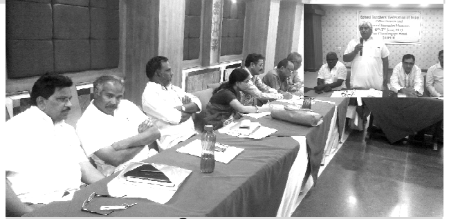
ఎన్టీఎఫ్ఐబి జాతీయ కార్యవర్గం సూచన

కేంద్రప్రభుత్వ వైఖరితో మహిళల, బాలికల పరిస్థితి వంట ఇంటికి, సంతానోత్పత్తికి పరిమితం అయ్యేట్లున్నదని సాధు, సంతుల వ్యాఖ్యలు మహిళాభ్యుదయాన్ని అడ్డుకునేరీతిలో ఉంటున్నాయని మన