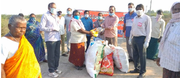
యు.టి.యఫ్ జిల్లా శాఖ