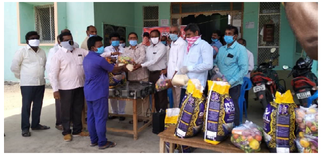
ముండ్లమూరు మండల శాఖ