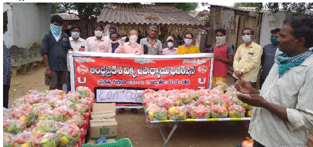
టంగుటూరు మండల శాఖ