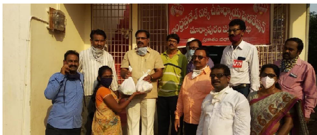
ఓంగోలు సగర శాఖ