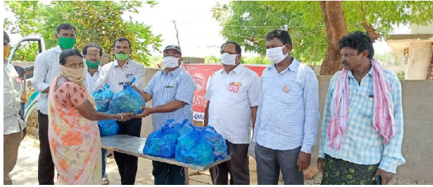
పి.సి.పల్లి మండల శాఖ