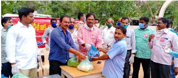
పొదిలి డివిజన్ (పొదిలి, కొనకనమిట్ల, మర్రిపూడి మండల శాఖలు)