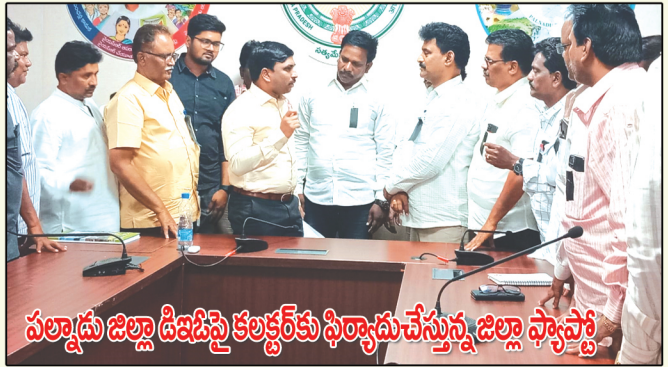
పల్నాడు జిల్లా డిజిటిల్ కలెక్షర్ కు ఫిర్యాదు చేస్తున్న జిల్లా ప్యాన్లెట్