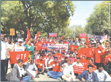
ఆంధ్రప్రదేశ్ నుండి పాల్గొన్న యుటియన్ నాయకత్వం