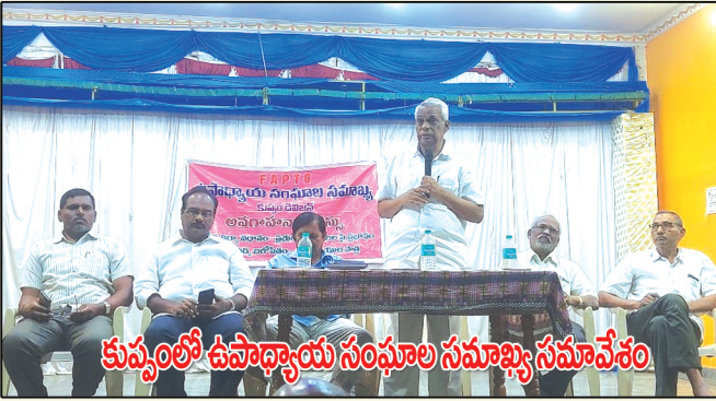
కృష్ణా జిల్లా సామాజిక సమావేశం