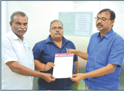
జాయింట్ డైరెక్టర్ కు యుటియన్ ప్రాతినిధ్యం