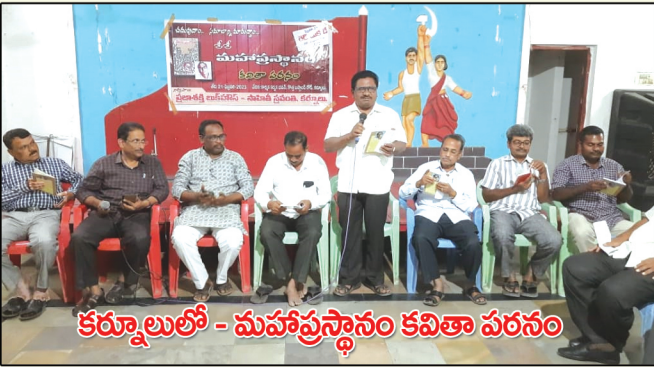
కర్నూలులో - మహాప్రస్థానం కవితా పఠనం