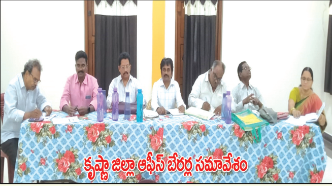
కృష్ణా జిల్లా ఆఫీస్ బేరల్ల సమావేశం