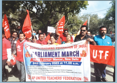
ఆంధ్రప్రదేశ్ నుండి పాల్గొన్న యుటియన్ నాయకత్వం