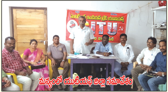
మన్యంలో యుటియస్ జిల్లా సమావేశం