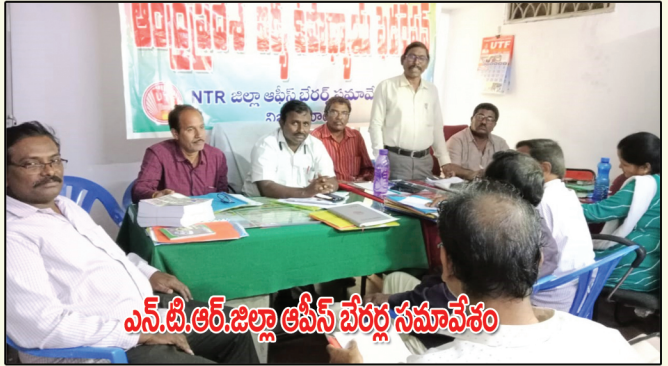
ఎన్.టి.ఆర్.జిల్లా ఆఫీస్ బేరల్ల సమావేశం