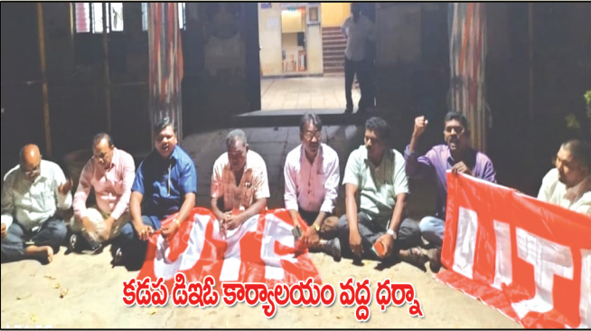
కడప డిజిటి కార్యాలయం వద్ద ధర్నా