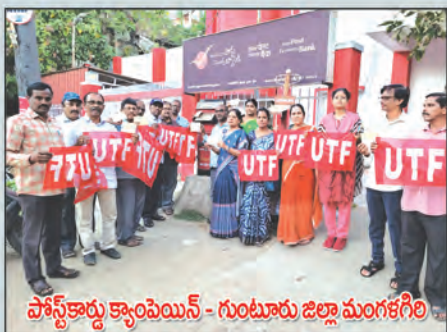
పోస్ట్ కార్డు క్యాంపెయిన్ - గుంటూరు జిల్లా మంగళగిరి