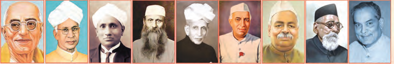
శ్రీ చక్రవర్తి రాజగోపాలాచారి 1954 డా॥ నర్సప్ప రాయాకృష్ణన్ 1954 డా॥ సి.వి.రామన్ 1954 డా॥ భగవాన్ దాస్ 1955 డా॥ ఎం.విశ్వనర ఠావు 1955 శ్రీ పండిట్ జవహర్‌లాల్ నెహ్రూ 1955 శ్రీ పండిట్ గోవిందవల్లభ్ పంట్ 1957 శ్రీ డోండో కేశవ కార్కే 1958 డా॥ దేదాన్ చంద్రారావు 1961