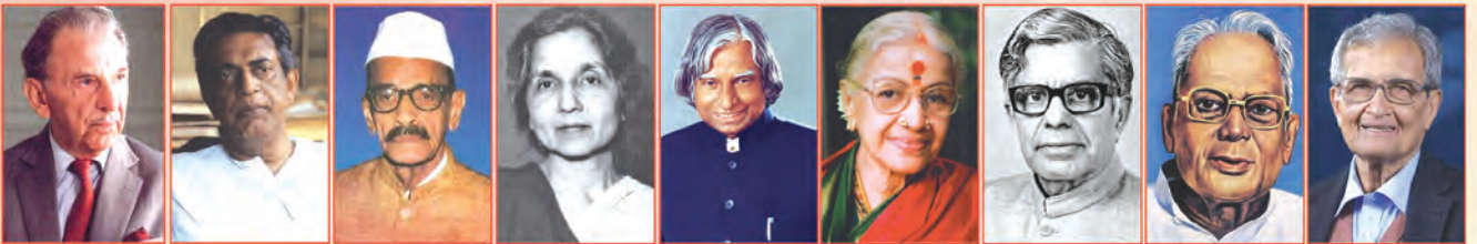
శ్రీ బాన్ దేవేంద్రారావు ఠాట 1992 శ్రీ సత్యజిత్ రాయ్ 1992 శ్రీ గుజ్రాలిలాల్ నందా 1997 శ్రీమతి అరుణ ఆసన్ అలి 1997 డా॥ పి.వి.జె.అబ్దుల్ కలామ్ 1997 శ్రీమతి ఎం.ఎన్.సుబ్బలక్ష్మి 1998 శ్రీ చందలల్ సుబ్రహ్మణ్యం 1998 శ్రీ జయప్రకాష్ నారాయణ్ 1999 ప్రా॥ అమర్త్యసేన్ 1999