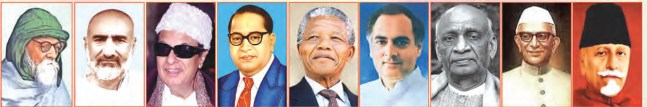
శ్రీ ఆచార్య వినోబ్ భవే 1983 శ్రీ బాన్ అబ్దుల్ సుబర్ ఖాన్ 1987 శ్రీ ఎం.గోపాలన్ రాంబందర్ 1988 డా॥ దేవరావ్ రాజేంద్రేష్ 1990 డా॥ నెల్సన్ మండేలా 1990 శ్రీ రాజీవ్ గాంధీ 1991 శ్రీ సర్దార్ వల్లాభాయ్ పటేల్ 1991 శ్రీ మోరార్జీ రాంచోద్రీ దేశాయి 1991 శ్రీ మోహన అబ్దుల్‌అజీజ్ 1992