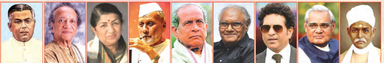
శ్రీ బి. లోక్నాయక్ గోపీనాథ్ 1999 శ్రీ పండిట్ రవిశంకర్ 1999 శ్రీమతి లతామంగ్లకర్ 2001 శ్రీ ఉస్మాన్ జిస్సా ఖాన్ 2001 శ్రీ పండిట్ భీష్మ్ గురూజీ జోషి 2009 ప్రా॥ సి.ఎన్.ఆర్. ఠావు 2014 శ్రీ సచిన్ రమేష్ టెండూల్కర్ 2014 శ్రీ అలర్ కేహర్ వాడేపేయ్ 2015 శ్రీ పండిట్ మహామోహన్ మాలవ్య 2015