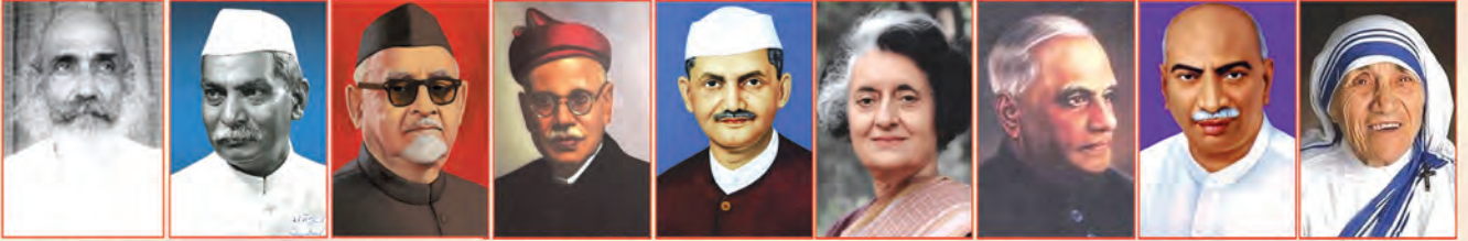
శ్రీ పురుషోత్తంధాన్ టాండన్ 1961 డా॥ రాజేంద్ర ప్రసాద్ 1962 డా॥ జాకీర్ హుస్సేన్ 1963 డా॥ పాండురంగ్ వామన్ కన్ 1963 శ్రీ రాలబహదూర్ శాస్త్రి 1966 శ్రీమతి ఇందిరా గాంధీ 1971 శ్రీ పరహగిరి వెంకటగిరి 1975 శ్రీ కె. కామరాజ్ 1976 మధుర్ థెరిస్సా 1980