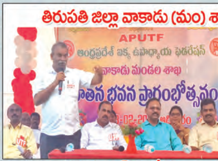
రాష్ట్ర అధ్యక్షులు ఎన్.వెంకటేశ్వర్లు